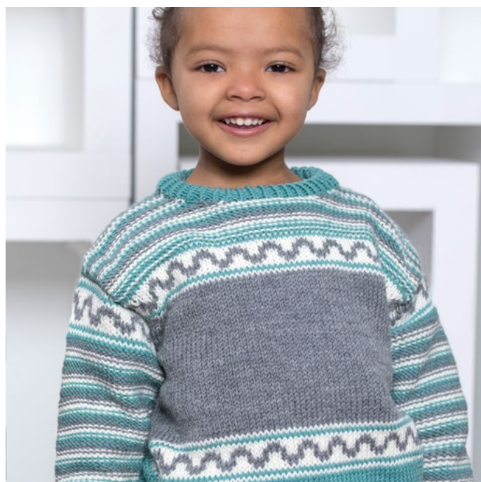
Høstgenser i blågrønn, se oppskrift LG19-87

MERINOULL er 100 % superwash merinoull i perletvinn. Den spesielle tvinningen gir et garn med mye volum og elastisitet som gir et svært jevnt og fint maskebilde. Garnet er mykt og lettstelt, og egner seg spesielt godt til baby- og barneplagg, men også til finere strikkeplagg til voksne. Vi anbefaler MERINOULL til alle typer strukturstrikk, fletter, hullstrikk, flerfarget og nordiske mønster.