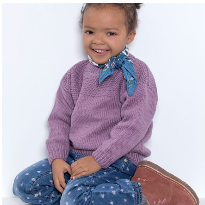
Kosegenser i lyng, se oppskrift LG19-88

MERINOULL er 100 % superwash merinoull i perletvinn. Den spesielle tvinningen gir et garn med mye volum og elastisitet som gir et svært jevnt og fint maskebilde. Garnet er mykt og lettstelt, og egner seg spesielt godt til baby- og barneplagg, men også til finere strikkeplagg til voksne. Vi anbefaler MERINOULL til alle typer strukturstrikk, fletter, hullstrikk, flerfarget og nordiske mønster.