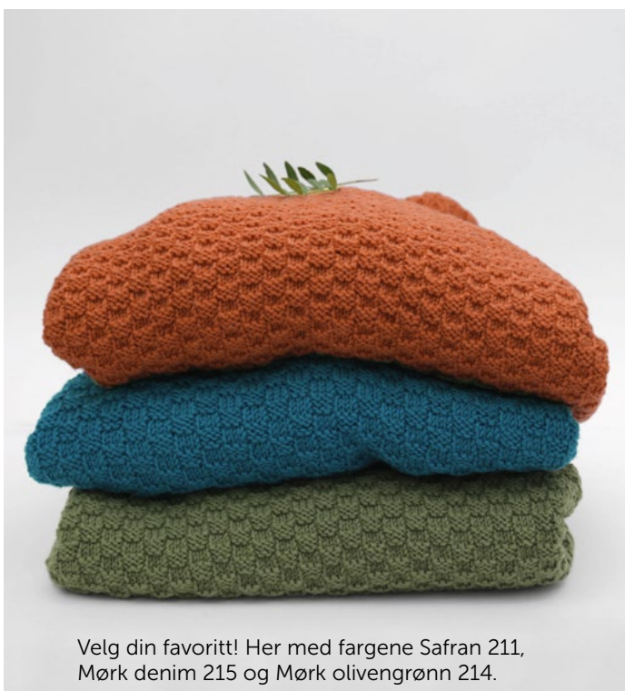
Velg din favoritt! Her med fargene Safran 211, Mørk denim 215 og Mørk olivengrønn 214.