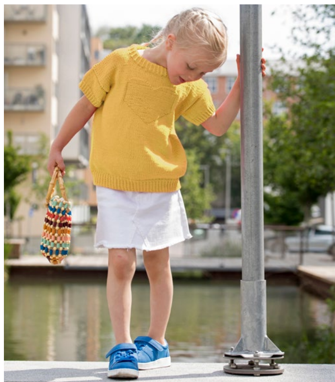
Prøv tee i gul | LG19-40

REN BOMULL er like flott til lekre sommer- topper, skjørt og gensere samt alle plagg til barn og baby.