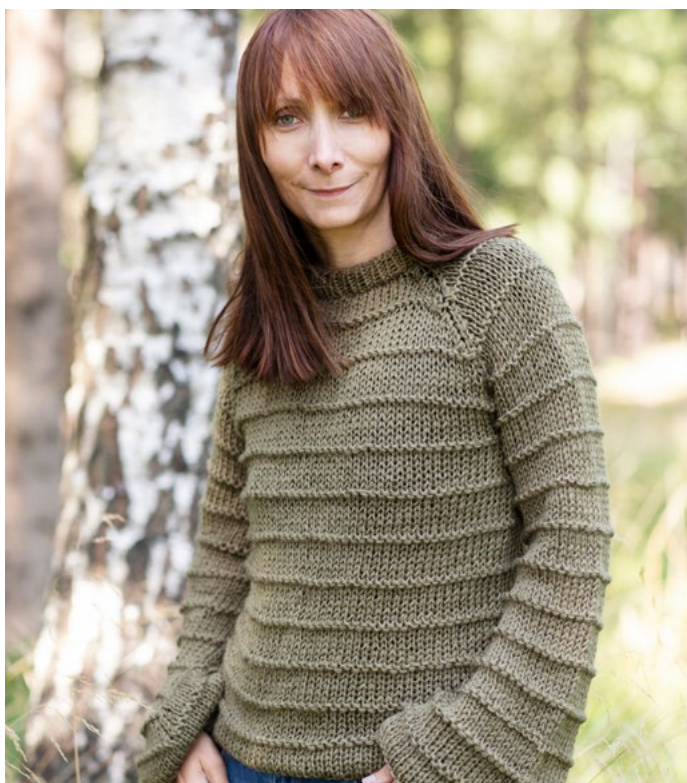
Se også oppskrift på Mosegenser | LG19-55

TYNN ULL er flott til finkofter, gensere, skjørt og jakker, for ikke å glemme til ullbukser og plagg til barnehageungen. Garnet er også velegnet til hekling, lappetepper og andre interiørprosjekter.