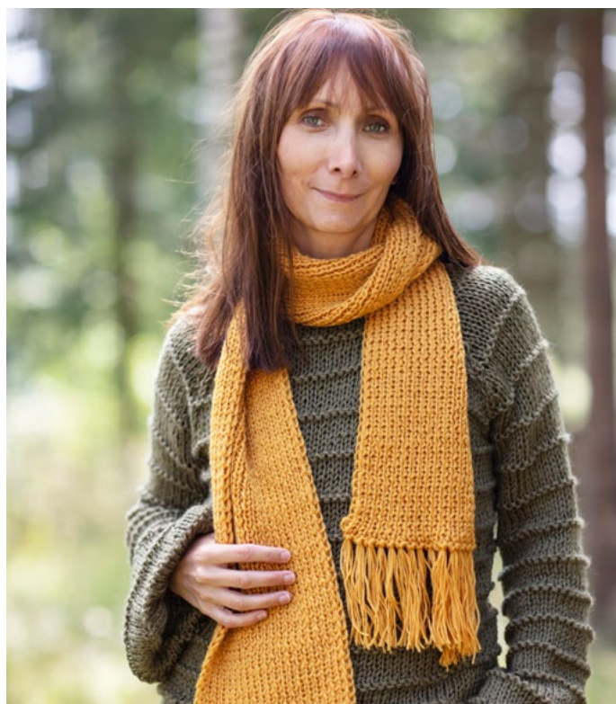
Se også oppskrift på Solgløtt skjerf | LG19-56