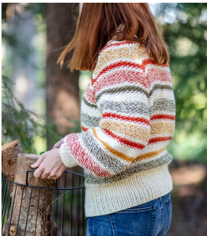
Se også oppskrift på Høstløv genser | LG19-54

TYNN ULL er flott til finkofter, gensere, skjørt og jakker, for ikke å glemme til ullbukser og plagg til barnehageungen. Garnet er også velegnet til hekling, lappetepper og andre interiørprosjekter.