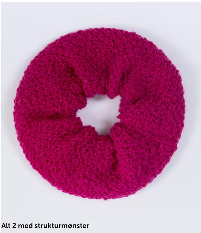
Alt 2 med strukturmønster