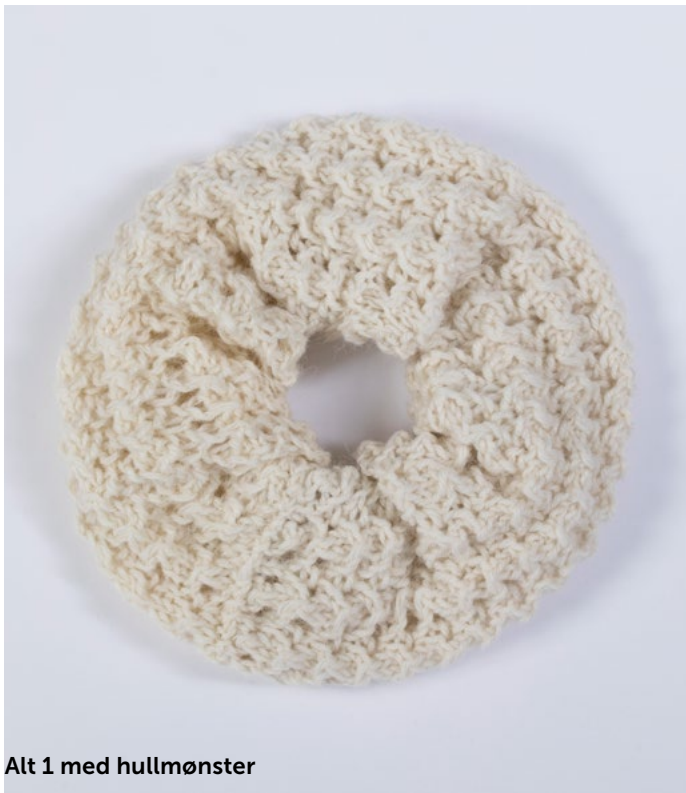
Alt 1 med hullmønster