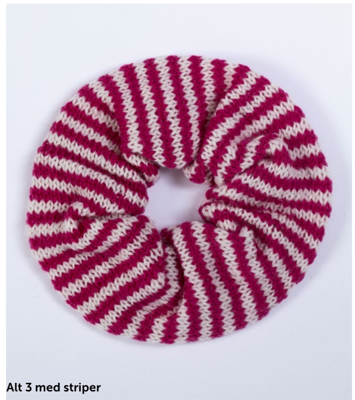
Alt 3 med striper