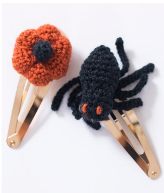
Halloween hårspenner | LG19-73

REN SW ULL holder seg svært godt etter lang tids bruk og vask. Her har du et godt garn til skigensere og kofter i norske tradisjonsmønstre, men også fine aranmønstre og strukturstrikk.