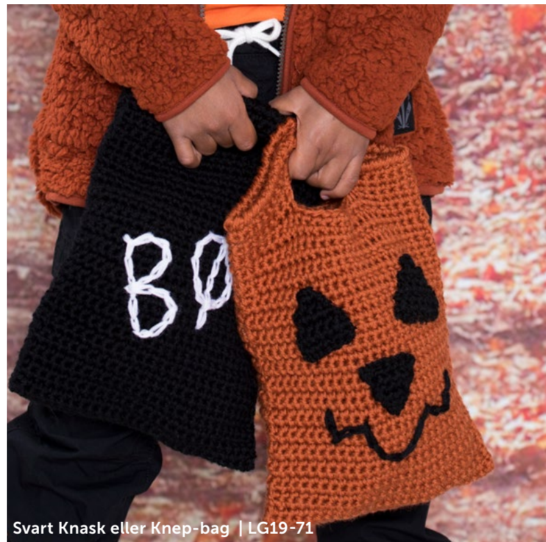
Svart Knask eller Knep-bag | LG19-71

Hekle 27 lm med farge 1 og heklenål nr 6. Snu, hopp over første lm og hekle 1 fm i hver av de øvrige lm = 26 fm. Les Hekletips! Hekle 2 rader med 1 fm i hver fm. *Neste rad hekles slik: 1 fm i hver av de første 8 fm, 10 lm, hopp over 10 fm (= åpning til hank) og hekle 1 fm i hver av de siste 8 fm. Snu, hekle 1 fm i hver fm og 10 fm om lm-raden*.