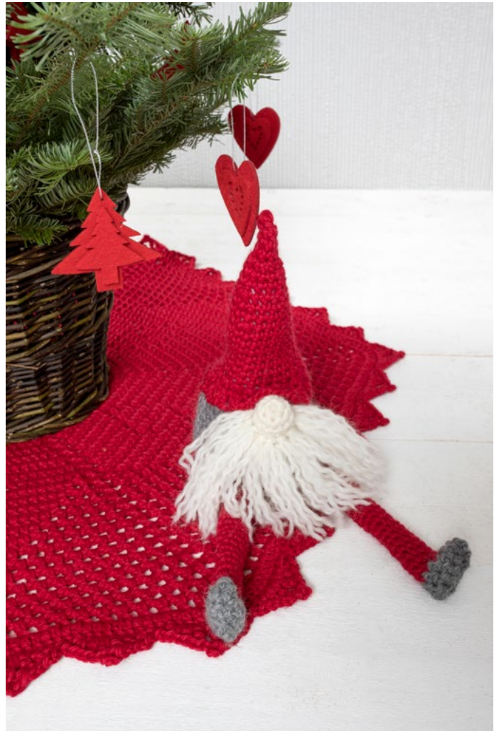
Juletreteppe, se oppskrift LG19-81