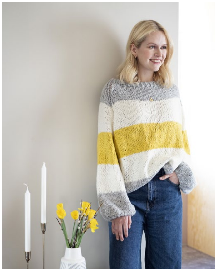
Se også Mabel genser med brede striper | LG19-20