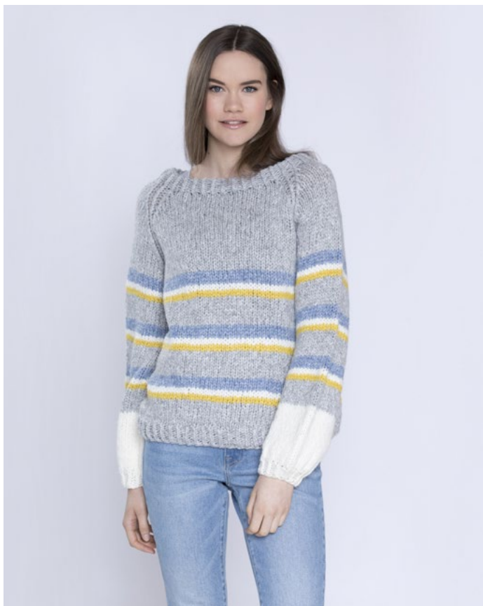
Se også Mabel Stripegenser | LG19-16

Tips! Prøv Lun Ull i samstrikk med de andre garntypene fra Linde Garn.